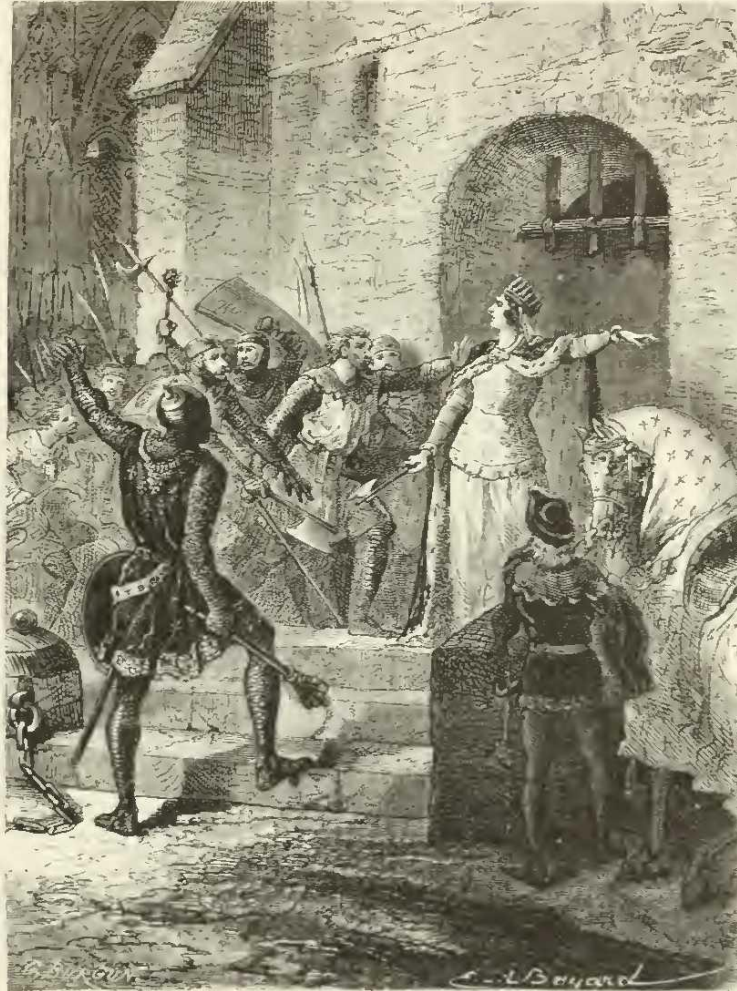
La reine Blanche délivre les serfs de Châtenai.

et à les remettre à flot au-dessous du camp des croisés, ces galères interceptèrent les vivres qui venaient par eau de Damiette.