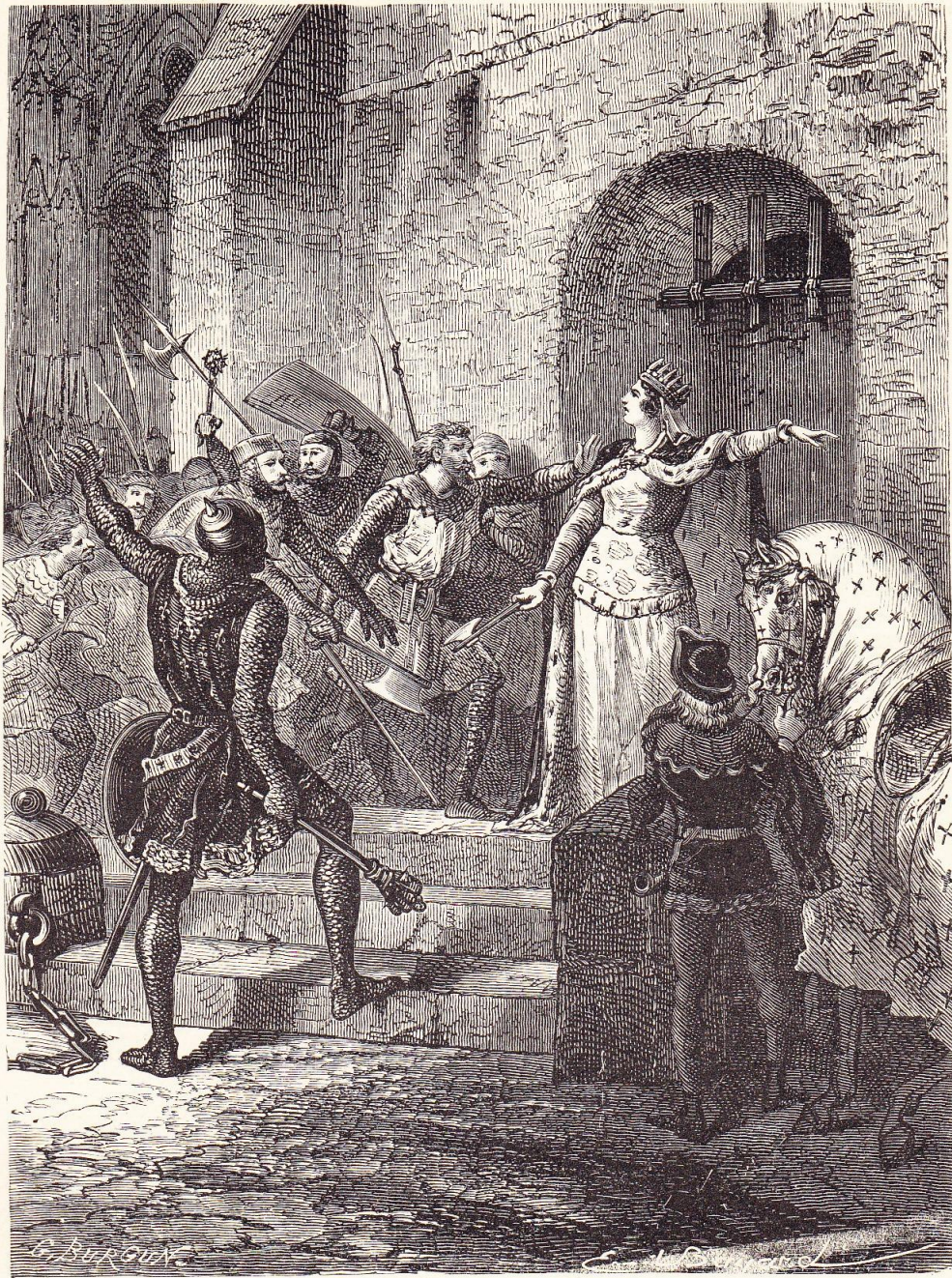
La reine Blanche délivrant des serfs (1233).